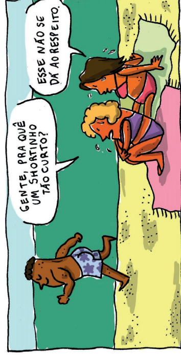
Figura 2. Charge “Shortinho” Autora: Carol Ito, (2020)

Agora que você escutou a música e aprofundou mais o conteúdo, vamos compartilhar algumas questões?