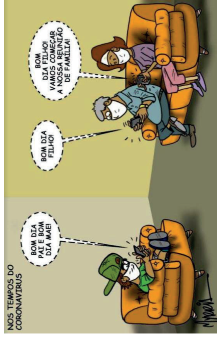
Figura 3. Charge publicada no site acritica.com Autora: Myrria. (2020)