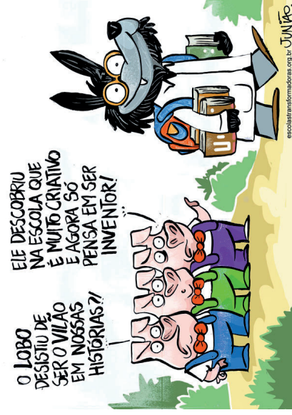
Figura 1. Charge sobre criatividade publicada originalmente no programa 'Escolas Transformadoras' do Instituto Alana. Autor: Junião. (2020)

1 Quais sentimentos a música “A lista” de Oswaldo Montenegro despertou em você?