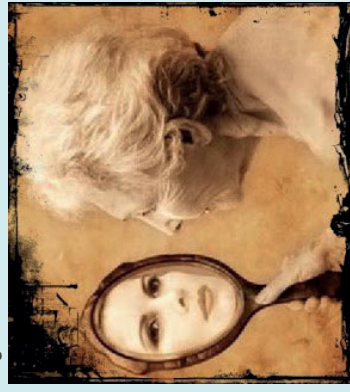
Figura 1. Onde você se reconhece?

Disponível em: < https://www.lettras.mus.br/oswaldo-montenegro/65521/ >. Acesso: 21 maio 2021