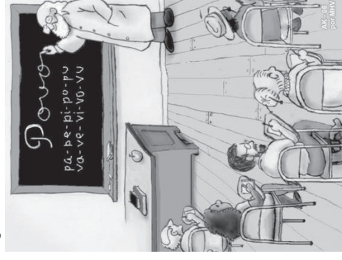
Autor: André Koehne