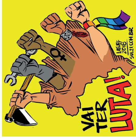
Autor: Carlos Latuff (2018).