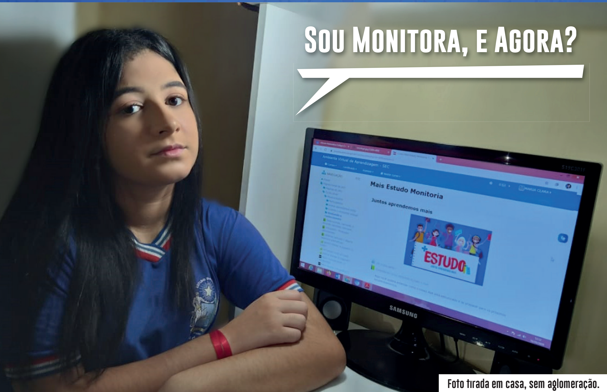
Foto tirada em casa, sem aglomeração.